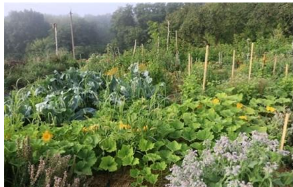
Ökologische Regeneration und Fortbildung trotz des Krieges – Kurse auf dem Gelände und im Gemüsegarten der Permakultur-Gemeinschaft „Zeleni Kruchi“, 90 km südlich von Kyiv.

Der gemeinnützige Verein „Permaculture in Ukraine“ verbindet ökologische Regeneration mit sozialem Engagement. Seit Beginn der russischen Invasion sind die Permakultur-Zentren Teil eines Netzwerks aus Gemeinschaftsorten, die Binnenflüchtlingen Schutz bieten. Seit dem Jahr 2022 konnten gemeinsam mit Partnern rund 3.000 Menschen versorgt werden. Heute ermöglichen fünf dieser Gemeinschaften auch Angebote zur Erholung und Traumabewältigung.