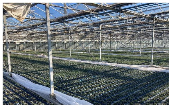
Durch die Unterstützung der Fluthilfe konnte das Gewächshaus wieder in Stand gesetzt werden.