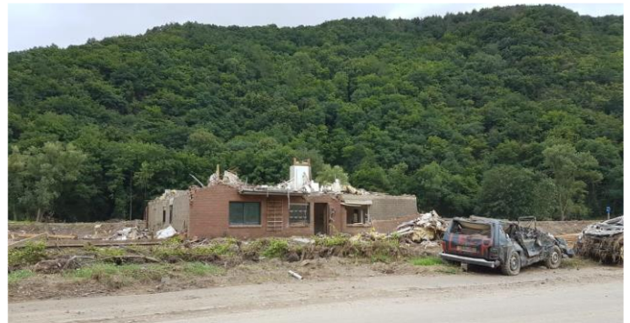
Zerstörtes Gebäude durch die Flut.