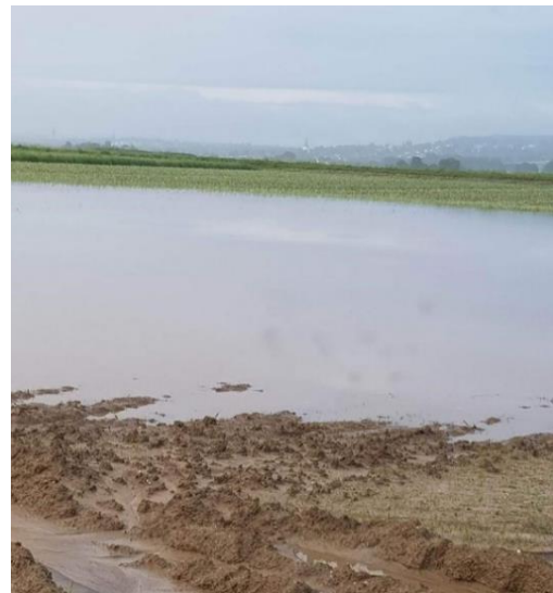
Überschwemmung des Ackers.

Nach der Flut 2021 gab es erhebliche Schäden im Gemüsebau und Ackerbau. Die Ernte der Speisekartoffeln, Radieschen, Stangenbohnen, Porree und Winterweizen fielen sprichwörtlich „ins Wasser“. Auch das Rhabarberfeld war überschwemmt, aber die Ernte in 2021 schon abgeschlossen.