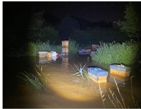
Die Zerstörung des Vermehrungsstandes in der Flutnacht.

Bei der intensiven Vermehrungsarbeit ist der Honigertrag und somit auch der Verkaufserlös allerdings gering und somit die finanzielle Situation der Imkerei angespannt. Deswegen fehlt es noch an neuen Schutzanzügen für die Fortbildungen und an weiteren Wirtschaftsvölkern und Wildbienenkästen. Für diese Anschaffungen, die im Jahr 2023 erfolgen sollen, werden weitere 7.900 € zurückgestellt.