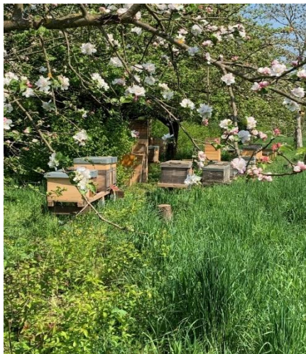
Obstblüte an Schloss Türnich 2022 - ein erster, kleiner Neuanfang der Imkerei.

Mit Hilfe der Unterstützung in Höhe von 5.000 € konnten neue Holzbeuten beschafft und für die Königinnenzucht eingesetzt werden. Weitere 5.000 € gingen durch die Soforthilfe NRW ein. Die Bioland Imkerei Weirich konnte seitdem wieder intensiv züchten, wodurch sie 2023 fast wieder das „Vor-Flut-Niveau“ erreichen und so auch etliche andere Imker*innen mit neuen Völkern versorgen konnte. Auch die Bestäubungsleistung für den Obstpark Schloss Türnich und an der Sophienhöhe in Kerpen konnten so wieder sichergestellt werden.