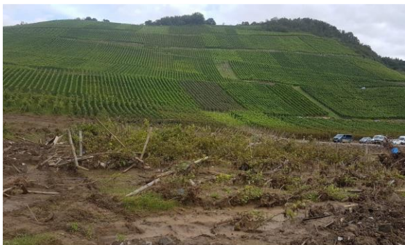
Durch die Flut beschädigte Weinberge.

Leider wurde in den letzten Monaten deutlich, dass der Wiederaufbau auf dem ursprünglichen Grundstück nicht möglich sein wird, da keine neuen Baugenehmigungen für die restlichen Gebäude vergeben werden. Dadurch wird Familie Trautwein sich auf ihren zweiten Standort im Kaiserstuhl konzentrieren und versuchen, dort den Bio-Betrieb auszubauen. Ähnlich wie Familie Trautwein geht es vielen Betrieben, die einen Wiederaufbau versuchen. Durch die behördlichen Prozesse und rechtlichen Vorgaben ist der Wiederaufbau im Ahrtal sehr schleppend. Wer die Möglichkeit hat, versucht an anderer Stelle Fuß zu fassen.